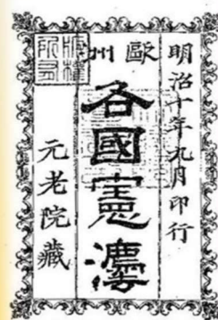
『欧洲各國憲法』元老院蔵 (国立国会図書館 ウェブサイトより)